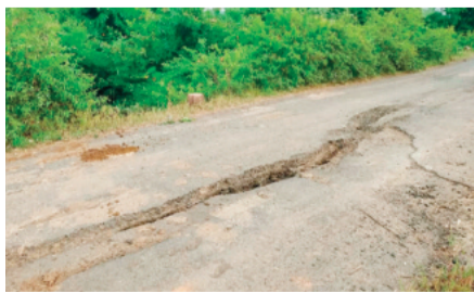
अगर समय रहते कार्रवाई नहीं हुई और कोई हादसा हुआ, तो इसकी पूरी जिम्मेदारी लोक निर्माण विभाग और संबंधित अधिकारियों की होगी। क्षेत्रीय जनता ने माननीय विदिशा कलेक्टर और लोक निर्माण विभाग से मांग की है कि तत्काल पुलिया का सर्वे कर नया पुल स्वीकृत किया जाए, अन्यथा आंदोलन की वेतावनी दी जाएगी।