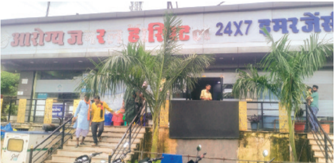
हरिभूमि न्यूज | ब्यावरा